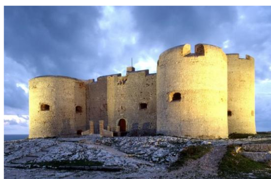
Château d'If

En 1516, François I er , roi de France, s'arrête à Marseille après la victoire de Marignan. De l'île d'If, il peut étudier les défenses de la ville pour constater que rien ne la protège contre les invasions. Il ordonne alors la construction d'une forteresse sur l'île. Ce n'est qu'en 1524, après une attaque de Charles Quint, que les premiers murs du château sont construits pour pouvoir enfin protéger l'accès du port de Marseille.