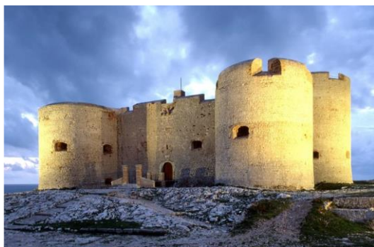
Château d'If

En 1516, François I er , roi de France, s'arrête à Marseille après la victoire de Marignan. De l'île d'If, il peut étudier les défenses de la ville pour constater que rien ne la protège contre les invasions. Il ordonne alors la construction d'une forteresse sur l'île. Ce n'est qu'en 1524, après une attaque de Charles Quint, que les premiers murs du château sont construits pour pouvoir enfin protéger l'accès du port de Marseille.