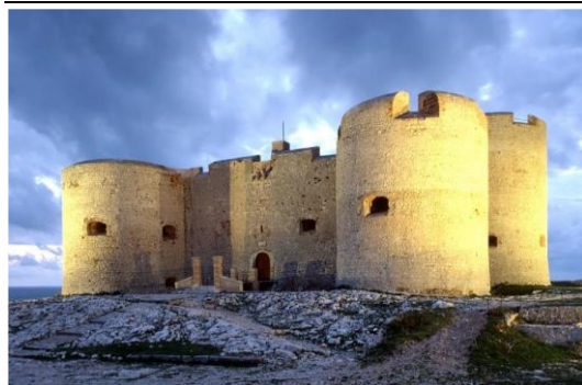
Château d'If